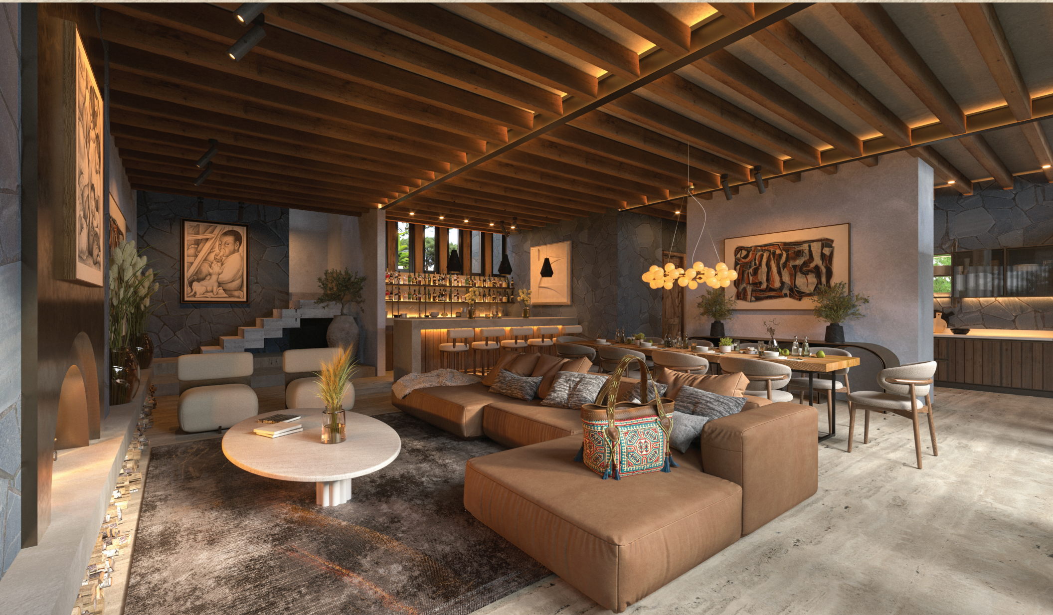
SALA Y COMEDOR.