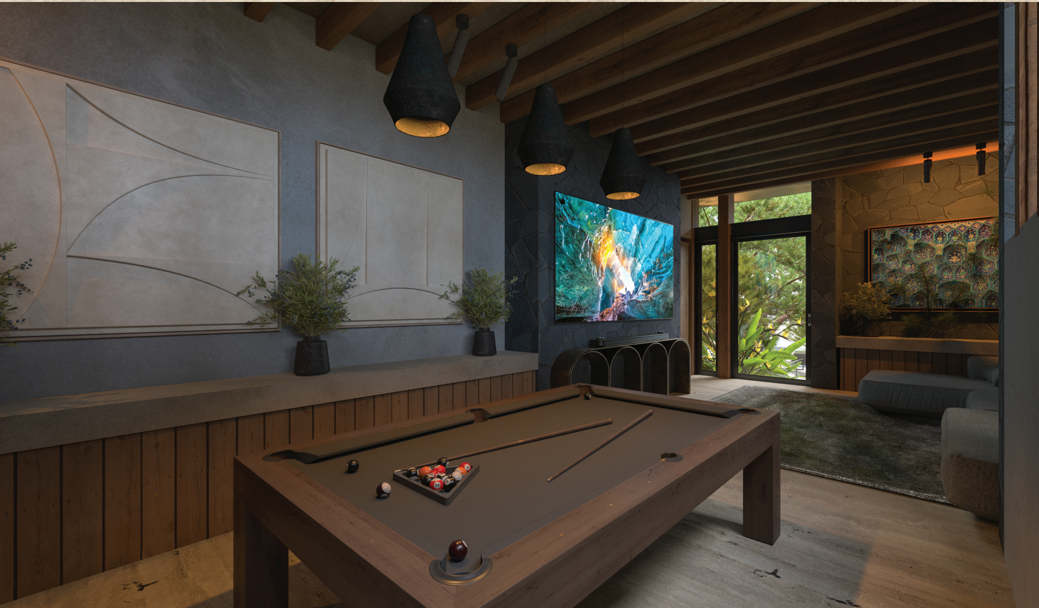
SALÓN DE JUEGOS.