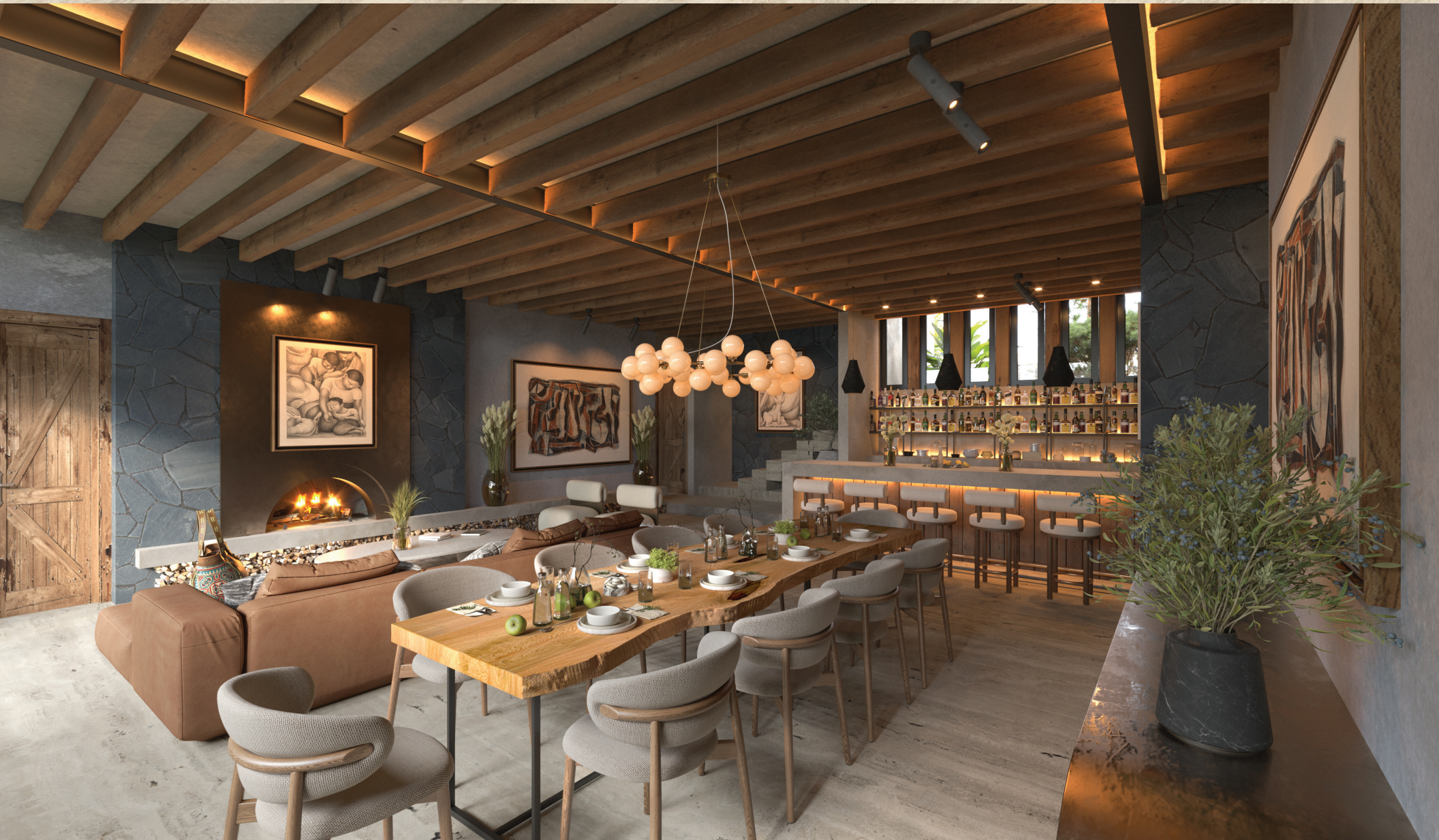
COMEDOR Y BAR.