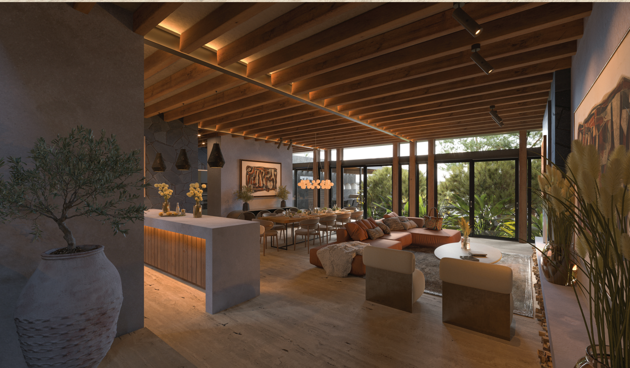
ENTRADA ÁREA SOCIAL.